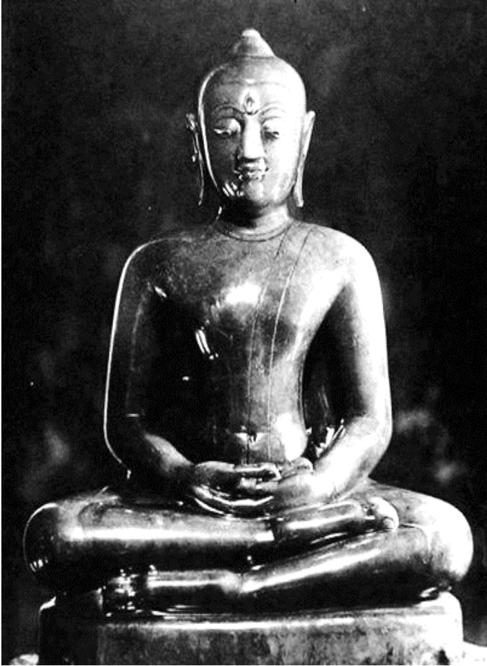
พระพุทธรูปหามณีรัตนปริมากร (พระแก้วมรกต) ไม่ทรงเครื่อง