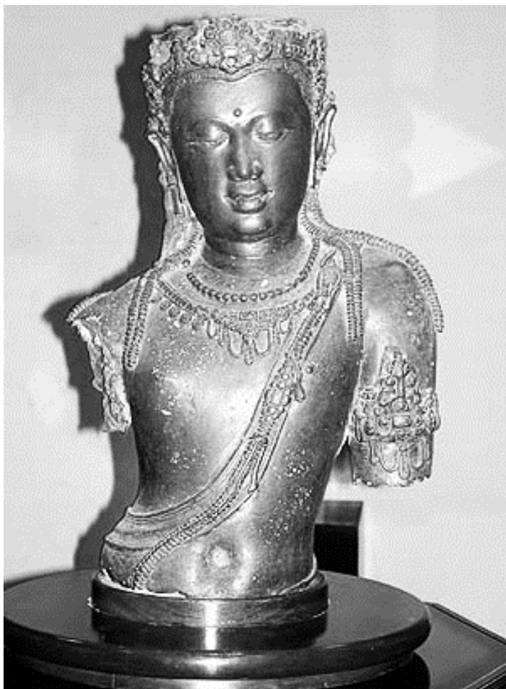
พระโพธิสัตว์อวโลกิเตศวร หรือ วัชรปราณี