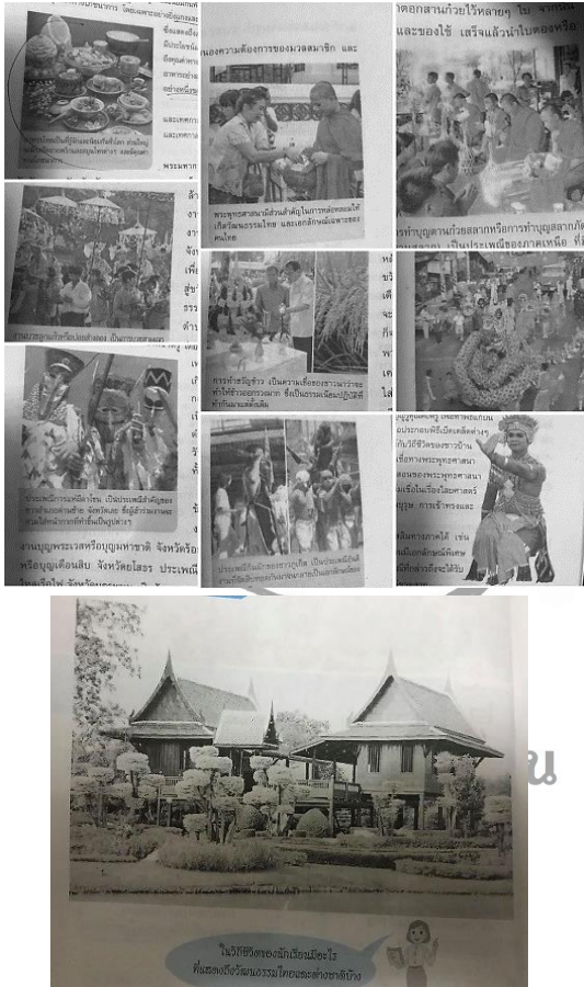
ภาพที่ 1-2 แสดงภาพที่เกี่ยวข้องกับวัฒนธรรมที่ปรากฏในหนังสือเรียนวิชาสังคมศึกษา จากหนังสือเรียนวิชาสังคมศึกษา ศาสนาและวัฒนธรรม ระดับชั้น ม.4-6 หน้า 38-49 ของสำนักพิมพ์อักษรเจริญทัศน์.

จำกัดในด้านเนื้อหาซึ่งจะกล่าวถึงในหัวข้อต่อไป ทั้งนี้นอกจากนั้นยังมีภาพที่เกี่ยวข้องกับวัฒนธรรมซึ่งถือว่าเป็นสื่อการเรียนรู้ที่ทำให้ผู้เรียนเกิดมโนคติต่อสิ่งต่าง ๆ ได้ชัดเจน ซึ่งขอแนะนำรูปภาพที่เกี่ยวข้องกับวัฒนธรรมที่ปรากฏในหนังสือเรียนวิชาสังคมศึกษาดังนี้