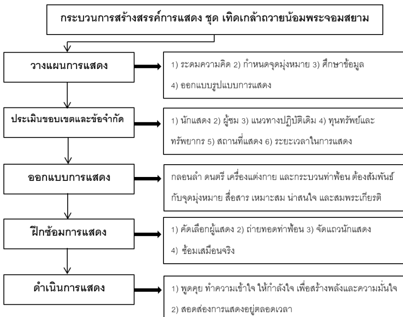
ภาพที่ 6 ผังกระบวนการสร้างสรรค์การแสดงชุดเทิดเกล้าถวายน้อมพระจอมสยาม